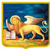
CONTRIBUTO REGIONE DEL VENETO